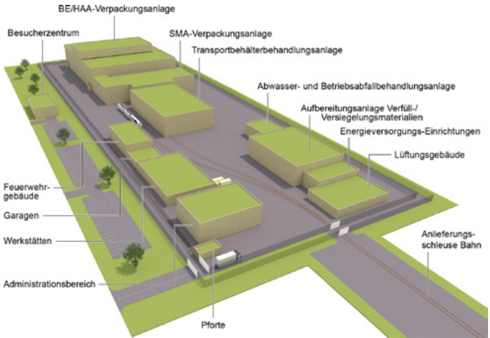
Schematische Darstellung der Elemente einer Oberflächenanlage